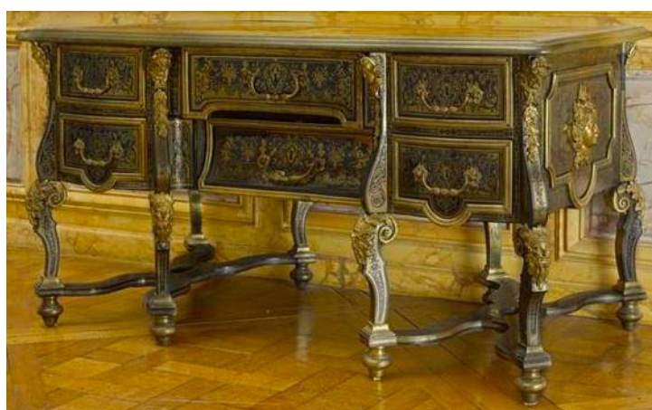
Fig. e : Bureau à caissons et à huit pieds à entretoises. Paris, vers 1700, marqueterie en première partie de laiton et d'écaïlle, bronze doré, 80,2x19,4x81,7 cm. anc. coll. Jean Bloch, puis Roudinesco, Château de Versailles. inv. V 4839

presqu'en même temps que trois autres bureaux à caissons d'un modèle très proche, mais entièrement recouverts en marqueterie de laiton et d'écaïlle. L'un d'entre eux, en marqueterie en première partie, faisait autrefois partie des collections royales de Saxe ; il fut abîmé lors de la destruction de palais royal de Dresde et semble toujours conservé dans les réserves du Kunstgewerbemuseum au château de Pillnitz. Le second, recouvert aussi en première partie appartenait à l'ancienne collection de Jean Bloch à Paris, lorsqu'il fut vendu le 21 mai 1957, sous le numéro 88, et par la suite au docteur Roudinesco, qui en fit donation au château de Versailles 2 , en 1972 (fig. e). Même si l'aspect général de ce dernier est identique à celui de Pillnitz et au suivant dont il va être question, ses côtés sont ornés d'un masque en bronze tout aussi important, mais représentant un visage d'Apollon. Enfin, le dernier, moins large et en seconde partie, qui est décoré lui de masques d'Hercule, provient des anciennes collections des princes Belosselsky-Belozersky 3 , vendues en 1921 4 , et se trouvait en 2006 dans le commerce de l'art parisien (fig. f-g).