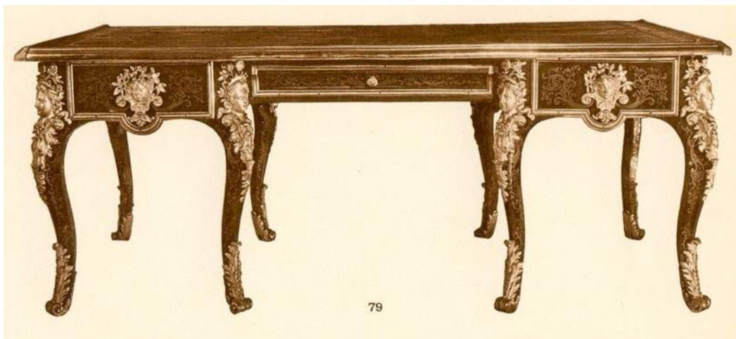
Fig. h, en haut : Grand bureau plat à huit pieds sans traverses et à trois tiroirs dans la ceinture. Paris, avant 1715, marqueterie en première partie de laiton et d'écaïlle, bronze doré. 80x207x105 cm, reproduit d'après le catalogue de la vente à Paris, galerie Georges Petit, Me Ader, 27 mai 1932, n°79

A peine plus tardif, un grand bureau plat à huit pieds légèrement galbés et sans entretoises, aussi recouvert en marqueterie de laiton et d'écaïlle en première partie et paré de riches bronzes, représente une évolution dans la production du même atelier, car il n'est doté que de trois tiroirs en ceinture. Ce bureau, ayant subi quelques altérations non significatives vraisemblablement au XIXe siècle, fut vendu en 1932 5 ( fig. h ), et est conservé actuellement à Paris, par le musée Carnavalet 6 . Comme le nôtre et le bureau Belosselsky-Belozersky, il est décoré également de masques d'Hercule sur les côtés ( fig. i ).