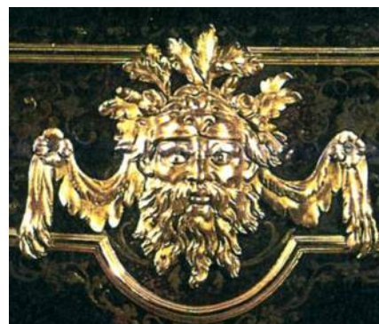
Fig. j k : Noël Gérard. Bureau plat à quatre pieds ornés de chutes à protomés de lions et de masques d'Hercule, estampillé NG. Paris, vers 1715, marqueterie en première partie de laiton et d'écaïlle, 82,5x170x82,5 cm, anc. coll. de John, 2e marquis de Bute, à Cardiff Castle. Christie's, Londres, 3 juillet 1996, n° 50