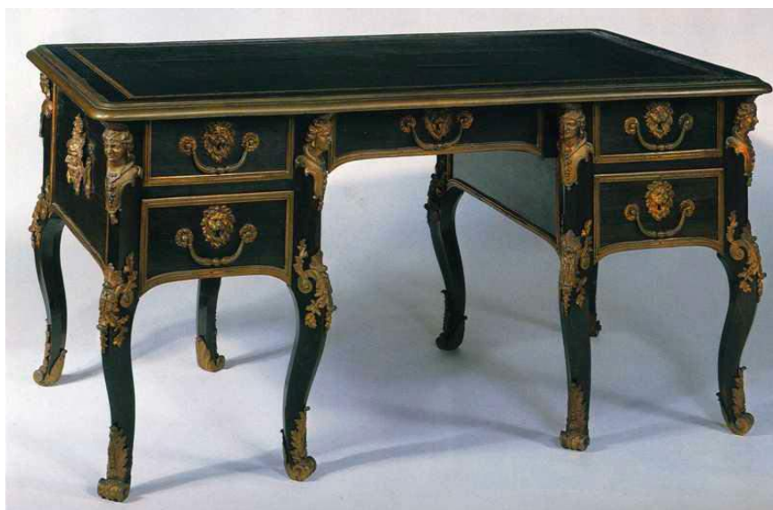
Fig. d : Le bureau reproduit dans le catalogue de la vente Christie's, Londres, du 12 avril 1984, où il figura sous le numéro 156

Ce bureau est, sans doute, la plus ancienne pièce d'un groupe de meubles qui présentent des bronzes identiques, notamment le masque d'Hercule avec la peau du lion de Némée couronné de branches de chêne. On pourrait ainsi placer sa réalisation aux alentours des années 1700,