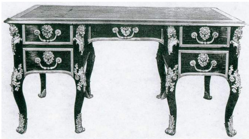
Fig. c : Le bureau reproduit dans le catalogue de la vente à Paris, Mes Couturier- Bondu, du 26 mars 1963, où il figura sous le numéro 85

On le retrouve dans une vente à Paris, au palais Galliera, poursuivie par les Maîtres Couturier et Bondu, le 26 mars 1963, sous le numéro 85, lorsqu'il fut reproduit ( fig. c ) puis chez Christie's, Londres, le 12 avril 1984, sous le numéro 156 ( fig. d ).