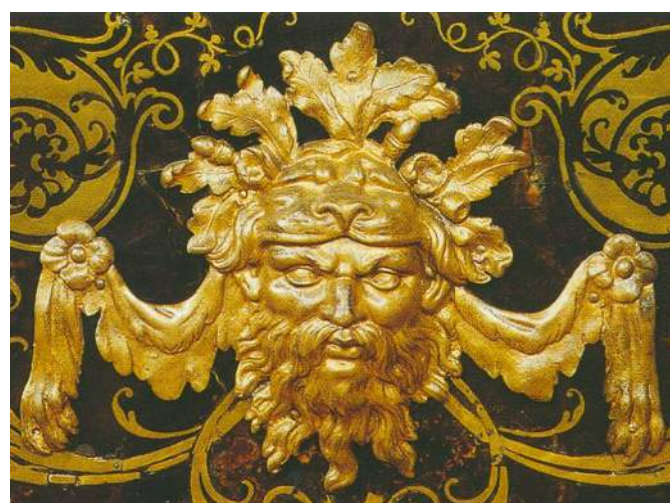
Fig. f, g : Bureau à caissons et à huit pieds à entretoises et détail du masque en bronze d'Hercule avec la peau du lion de Némée. Paris, vers 1700, marqueterie en seconde partie de laiton et d'écaïlle, bronze doré, 85x15,0x81 cm. anc. coll. Constantin Espèrovitch, 3e prince Belosselsky-Belozersky, vente, Paris, 17 juin 1921, n° 46, puis commerce de l'art parisien en 2006