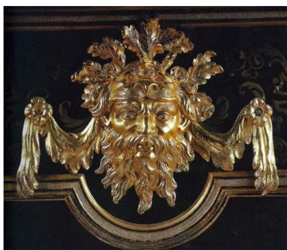
Fig. i, en bas : Détail du masque d'Hercule en bronze doré, disposé sur l'une des côtés du bureau de la fig. g, Paris, musée Carnavalet, inv. MB 612

Le bureau du musée Carnavalet constitue la transition vers le modèle le plus évolué de la série, qui est un bureau plat, toujours recouvert en marqueterie de laiton et d'écaïlle et présentant les mêmes masques d'Hercule en bronze doré ( fig. j-k ). Ce dernier porte l'estampille abrégative NG, qui est celle du marchand-ébéniste Noël Gérard. On retrouve aussi cette estampille, ainsi que le masque d'Hercule, sur une commode, en bois de placage portant le fer NG ( fig. l-m ). Si le bureau